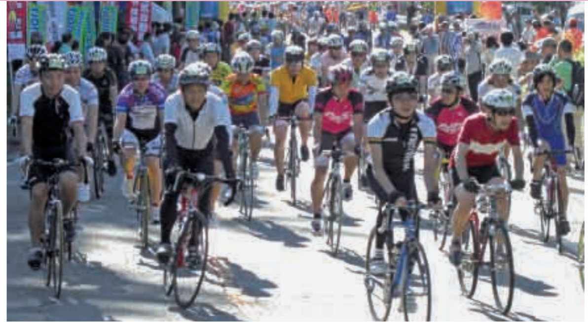
写真は昨年(2010年)の全日本マウンテンサイクリング in 兼乗(長野)での様子