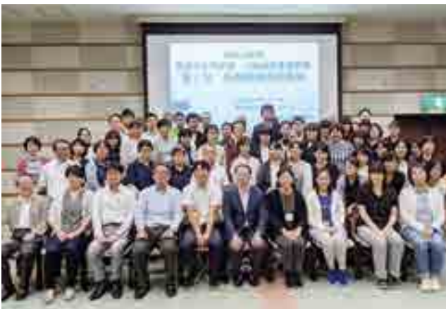
研修会には職種の垣根を越えて多くの専門職が集まる