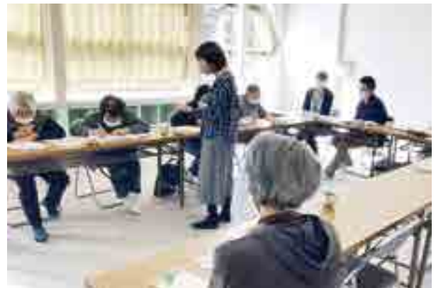
成羽町で開催したACPの実践講座