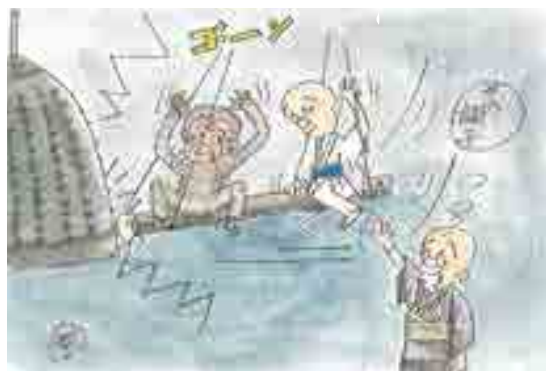
山寺の師走の晩鐘 猿の役

② りょうて ゆび わ 両手2指の輪をひらひらさせ ながら下ろす(雪が降る様子)