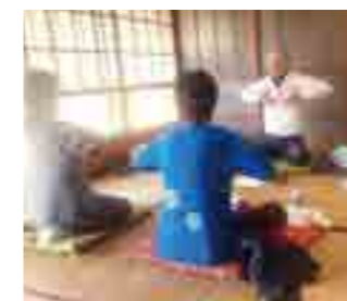
丹田呼吸合宿(有漢町)

丹田呼吸は、古来より東洋で伝わり日本で発展してきた「呼吸による健康法」です。無理のない呼吸に