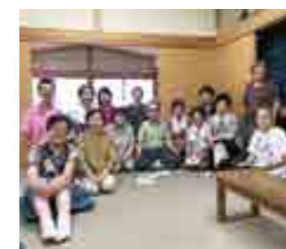
サロンでの丹田呼吸(巨瀬町)

私はこれを高梁の地から発信する取り組みを進めています。すでに市内のさまざまな会合やサロンなどで丹田呼吸を体験して頂いています。興味のある方は気軽にご連絡ください。